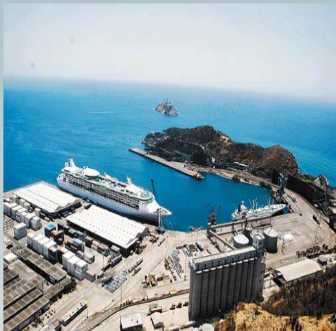
Foto Aérea Puerto de Santa Marta

Por una parte, en el Departamento del Magdalena, cuya capital es el municipio portuario de Santa Marta, quiere abordarse un proyecto que aporte una visión general que permita tomar decisiones sobre su desarrollo logístico, atendiendo tanto a la demanda captable como a la interacción de la infraestructura que se desarrolle con un parque natural adyacente.