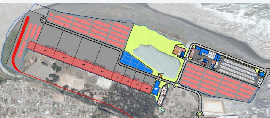
Sector Sur, Puerto San Antonio, Chile.

Actualmente, la primera fase está completamente culminada, mientras que la segunda fase ha cumplido también todas las etapas correspondientes, a pesar de que se sigue trabajando con las dudas y necesidades del cliente para que éste pueda hacer uso práctico del modelo elaborado de forma efectiva.