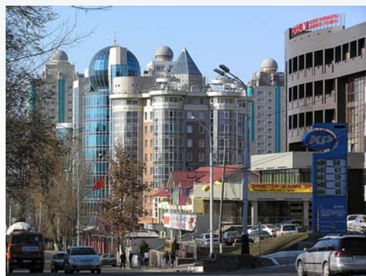
Foto Almaty, Kazajstán

El mercado de abastos estaría orientado básicamente a frutas y verduras, ya que en dicho país, de temperaturas tan extremas, tanto frutas como verduras son importadas y el aprovisionamiento y distribución se realizan de forma poco estructurada.