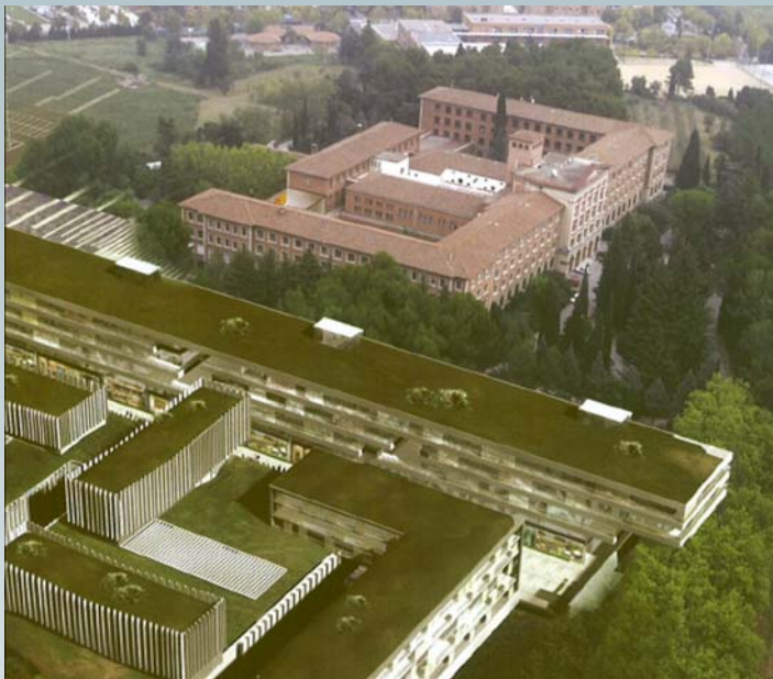
Proyecto ESADE– Creápolis

La ZAL constituye un clúster logístico de empresas del sector con actividades afines y complementarias; en cambio, la visión de ESADE – Creápolis es justamente la inversa: la de un anti – clúster que, precisamente por ello, puede aportar enfoques diferentes e innovadores sobre problemas comunes tanto a los usuarios de la ZAL como a proyectos del ILI.