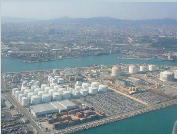
Puerto de Barcelona

El Plan de ampliación de horarios de la operativa terrestre del puerto de Barcelona comenzado en el mes de noviembre de 2008, finalizó a mediados del mes de abril de este año, con la entrega de las conclusiones y recomendaciones finales.