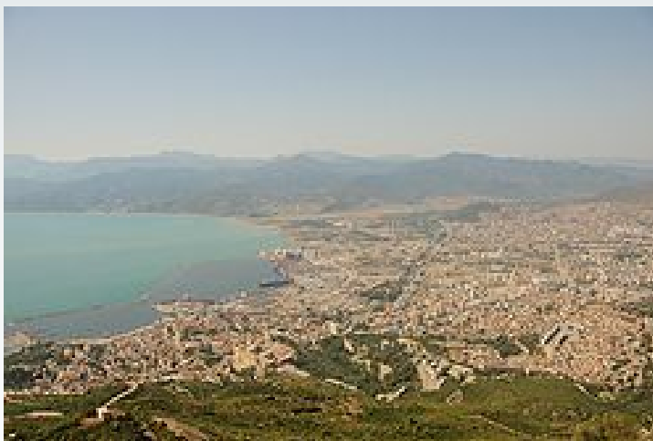
Foto Aérea Puerto de Bejaia

El puerto de Bejaia participa en el proyecto MEDA – MoS, promovido por la Comisión Europea y en el que también participa la Autoridad Portuaria de Barcelona (APB), cuyo objetivo es poner en marcha una línea de “Short Sea Shipping” entre este puerto y el de Barcelona.