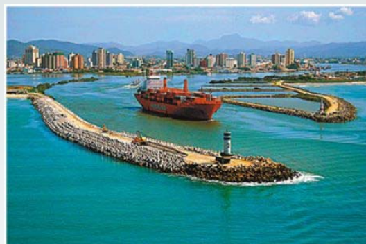
Foto Aérea Puerto de Navegantes, Santa Catarina

El proyecto cuenta con el apoyo del Estado y su comienzo está pendiente del proceso de tramitación administrativa.